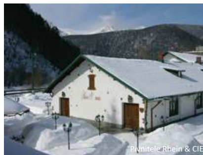
Pivnitele Rhein &amp; CIE