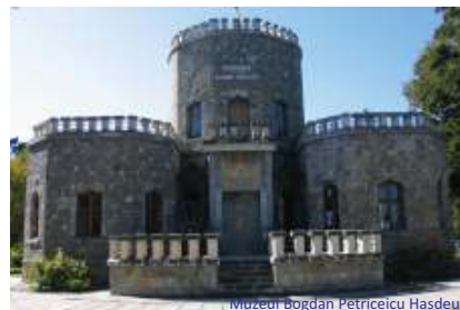
Muzeul Bogdan Petriceicu Hasdeu