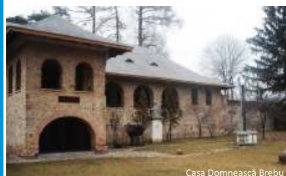
Casa Domnească Brebu

Program: zilnic 9.00 – 17.00, luni închis