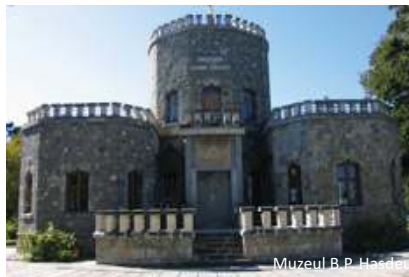
Muzeul B.P. Hasdeu

naționalizarea din 1948, ea devenind apoi un sanatoriu al Ministerului de Interne. Ea adăpostește astăzi un muzeu.