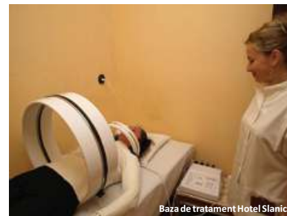
Baza de tratament Hotel Slănic

Slănic este dotată cu aparatură modernă. Bolile cronice ale aparatului respirator (astm bronic, bronșita cronică, bronhopneumopatie cronică obstructivă, emfizem pulmonar, infecțiile recurente ale tractului respirator superior, rino-sinuzite cronice, laringo-traheite cronice) beneficiază de tratament complex recuperator reprezentat de: microclimatul de salina; aerosoloterapie; electroterapie (MDF, unde scurte, ultrasunete, infraroșii și ultraviolete, microunde); kinetoterapie respiratorie; masoterapie.