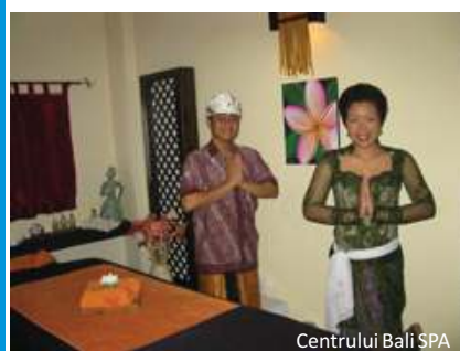
Centrul Bali SPA

În Prahova găsim 3 centre specializate de SPA și tratament la Cornu – Centrul Bali SPA***, Breaza - Complexul de Terapie Naturală Alexandra*** și Slănic – Baza de tratament din cadrul Hotelului Slănic***.