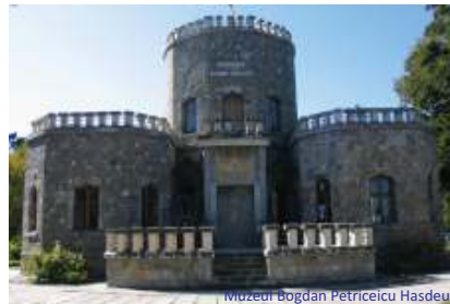
Muzeul Bogdan Petriceicu Hasdeu

Program: 9.00–17.00 (vara), 8.00–16.00 (iarna), luni închis