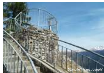
Stâncile "Franz Joseph"

nată de evenimentele politice dintre anii 1945 -1946, Enescu semnează la Paris un act de donație, prin care vila "Luminiș" urma să devină un așezământ cultural, conceput ca o casă de odihnă și reculegere pentru artiștii români și străini.