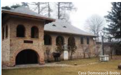
Casa Domnească Brebu

Program: zilnic 9.00 – 17.00, luni închis