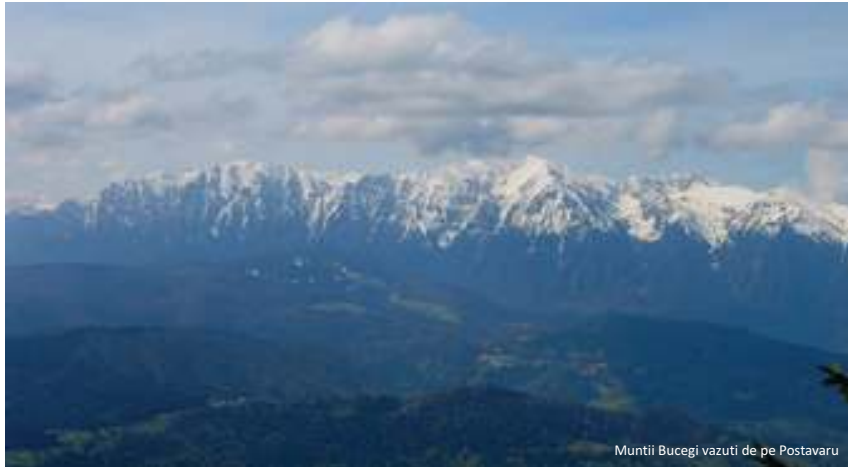
Muntii Bucegi vazuti de pe Postavaru

Cu toate acestea, Pelișorul cu arhitectura sa - Stilul renașterii germane, cu turlele sale acoperite cu țiglă smălțuită cu culori vii, cu cele 70 de camere decorate artistic, este un veritabil castel care va fi locuit permanent vara. Încă de la început el a constituit reședința prinților moștenitori: Ferdinand și Maria soția lui. Aici au