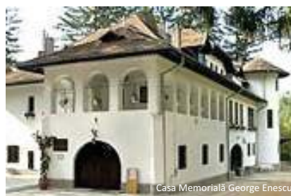
Casa Memorială George Enescu

Mormantul lui Tache Ionescu - cunoscut om politic, născut la Ploiești, acesta și-a dedicat întreaga sa activitate reîntregirii neamului.